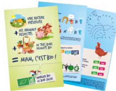
100 dépliants ludopédagogiques