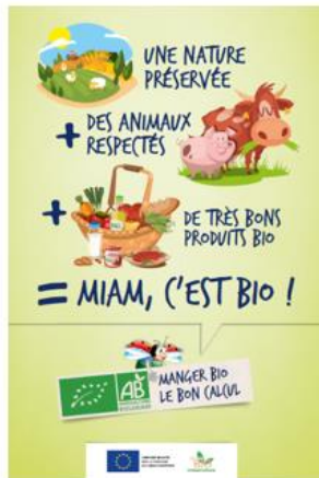
L'affiche (60*80 cm)