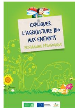
Le guide pédagogique (18 pages)