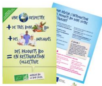
Le mémorandum pour les professionnels de la restauration collective (4 pages A5)