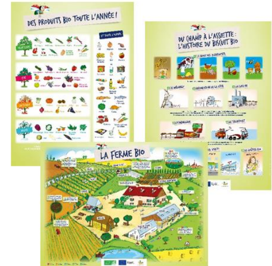
Les trois posters (60*80cm)