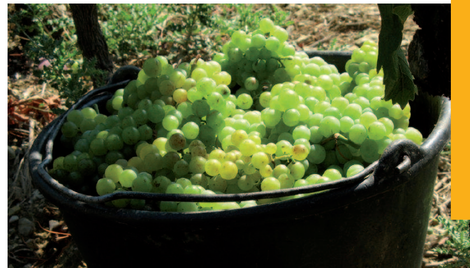
Evolution des surfaces de vigne en mode de production biologique