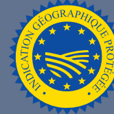
LES PRODUITS BÉNÉFICIAINT D'UNE INDICATION GÉOGRAPHIQUE (IGP)