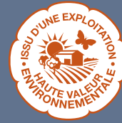
LES PRODUITS BÉNÉFICIAINT DE LA MENTION « ISSU D'UNE EXPLOITATION À HAUTE VALEUR ENVIRONNEMENTALE » (HVE)

54 produits bénéficient de la mention STG en Europe, tels que la mozzarella en Italie, le jambon Serrano en Espagne ou la moule de Bouchot en France.