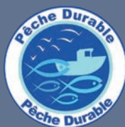
LES PRODUITS ISSUS DE LA PÊCHE MARITIME BÉNÉFICIAINT DE L'ÉCOLABEL PÊCHE DURABLE

Les produits issus d'une exploitation bénéficiant de la certification environnementale de niveau 2 entrent également dans le décompte uniquement jusqu'au 31 décembre 2029.