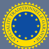
LES PRODUITS BÉNÉFICIAINT D'UNE SPÉCIALITÉ TRADITIONNELLE GARANTIE (STG)

54 produits bénéficient de la mention STG en Europe, tels que la mozzarella en Italie, le jambon Serrano en Espagne ou la moule de Bouchot en France.